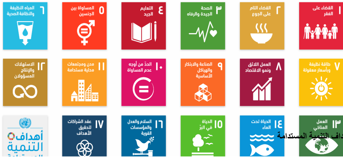
شكل (2) اهداف التنمية المستدامة