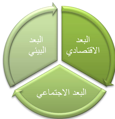
شكل (1) ابعاد الاستدامة التي تحقق الاستدامة الشاملة

ومن وجهة نظر مصرفية، فان ابعاد الاستدامة الثلاثة ليست مستقلة عن بعضها بل انها مكملة لبعضها الاخر لتحقيق هدف الاستدامة الشاملة وضمان استمرار المؤسسة المالية وتعظيم قيمتها وزيادة قدرتها التنافسية بما لا يؤثر على الموارد الطبيعية والبيئية المختلفة، والمخطط التالي يوضح الية الترابط بين الابعاد الثلاثة لاستدامة المؤسسة المالية.